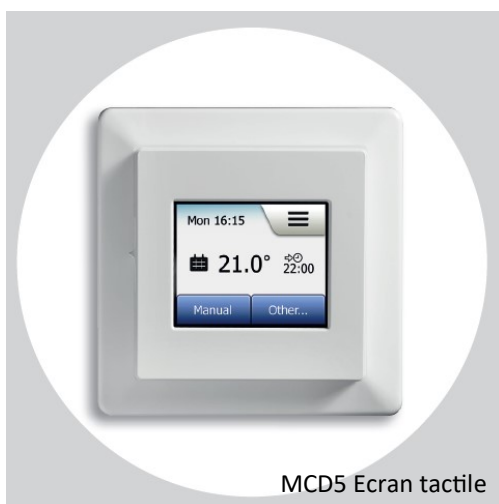
MCD5 Ecran tactile