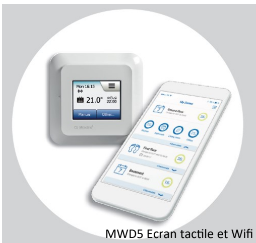
MWD5 Ecran tactile et Wifi